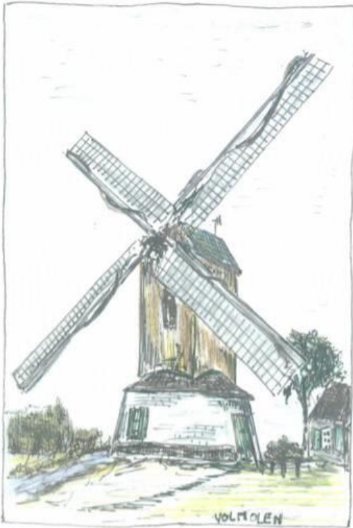
Reconstructietekening van de volmolen aan de Heesch.

In 1760 kreeg cartograaf Diederik Zijnen (1730-1768) opdracht van Gijsbertus, Graaf van Hogendorp om een manuscriptkaart te vervaardigen met hierop ingetekend alle bezittingen en eigendommen binnen de Heerlijkheid Tilburg en Goirle.